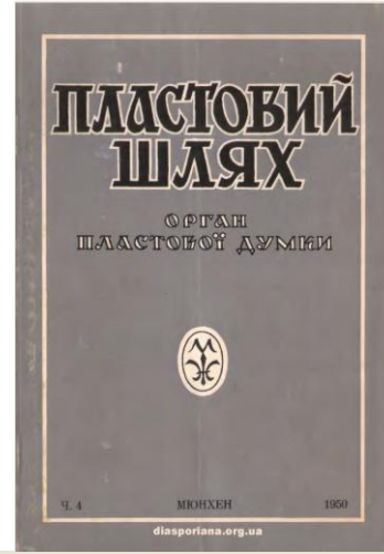
Кудю йти? Пластовий шлях . Орган пластової думки. 1950. Ч. 1 (4), жовтень. Мюнхен (Німеччина). С. 3-7.