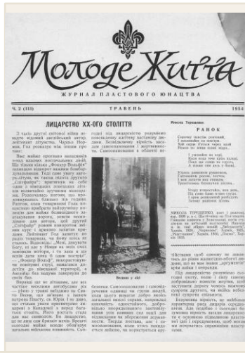
Будь українським пластуном. Молоде Життя . Журнал пластового юнацтва. 1954. Ч. 2 (113), травень. Філадельфія. С. 2-3