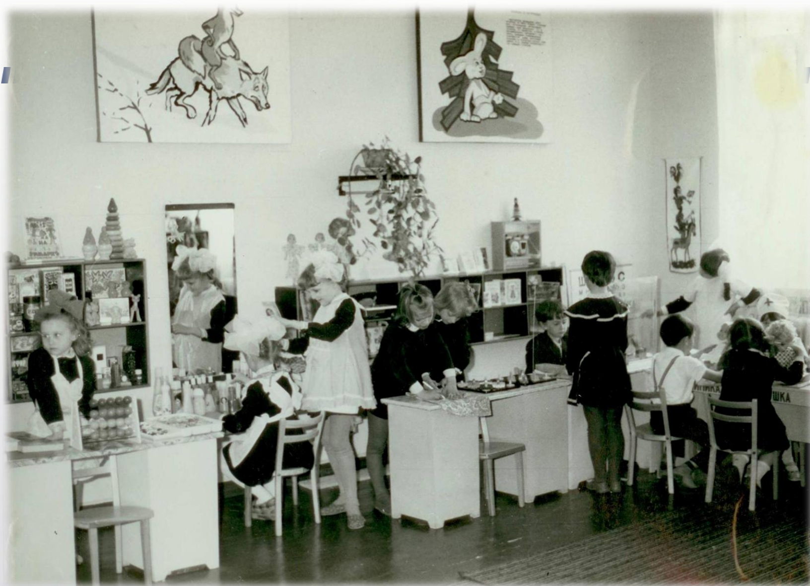
Світ навколо тебе. Ознайомлення з професіями. 1979-1980 н.р