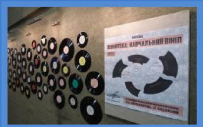
Виставка «Фонотека: навчальний вініл» доступна для відвідувачів протягом літа