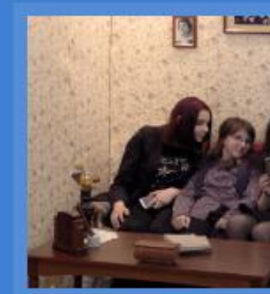
Відкриття виставки «1917 - ...»