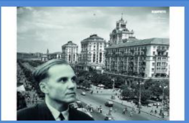
Відкриття виставки «Київ Сухомлинського» (до 99-ї річниці від дня народження педагога)