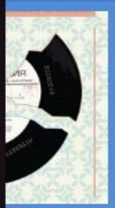
«Фонотека: навчальний вініл»