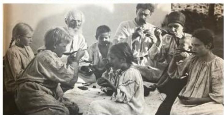
До 150-річчя Василя Кричевського