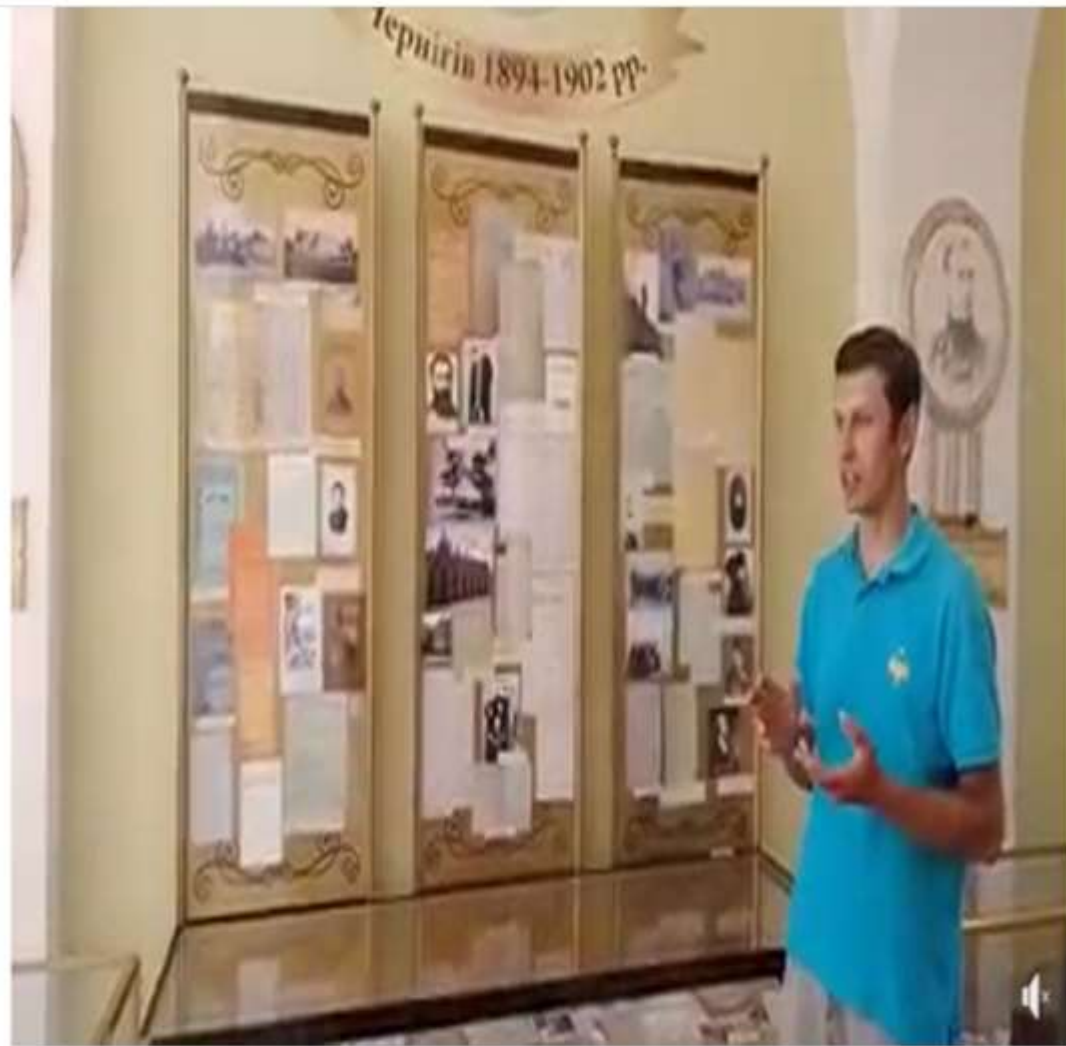
Марія Грінченко: Чернігівський період