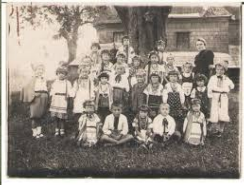
Український дитячий садок поч.20ст.

Наталія Лубенець- український педагог і культурний діяч, голова Товариства народних дитячих садків міста Києва, засновник і редактор журналу «Дошкольное воспитание», який виходив у Києві у 1911—1917 рр., лектор Фребелівського педагогічного інституту, член Колегії дошкільного виховання при Департаменті народної освіти у 1918—1919 рр. Основна праця: «Фребель і Монтессорі» (1915).