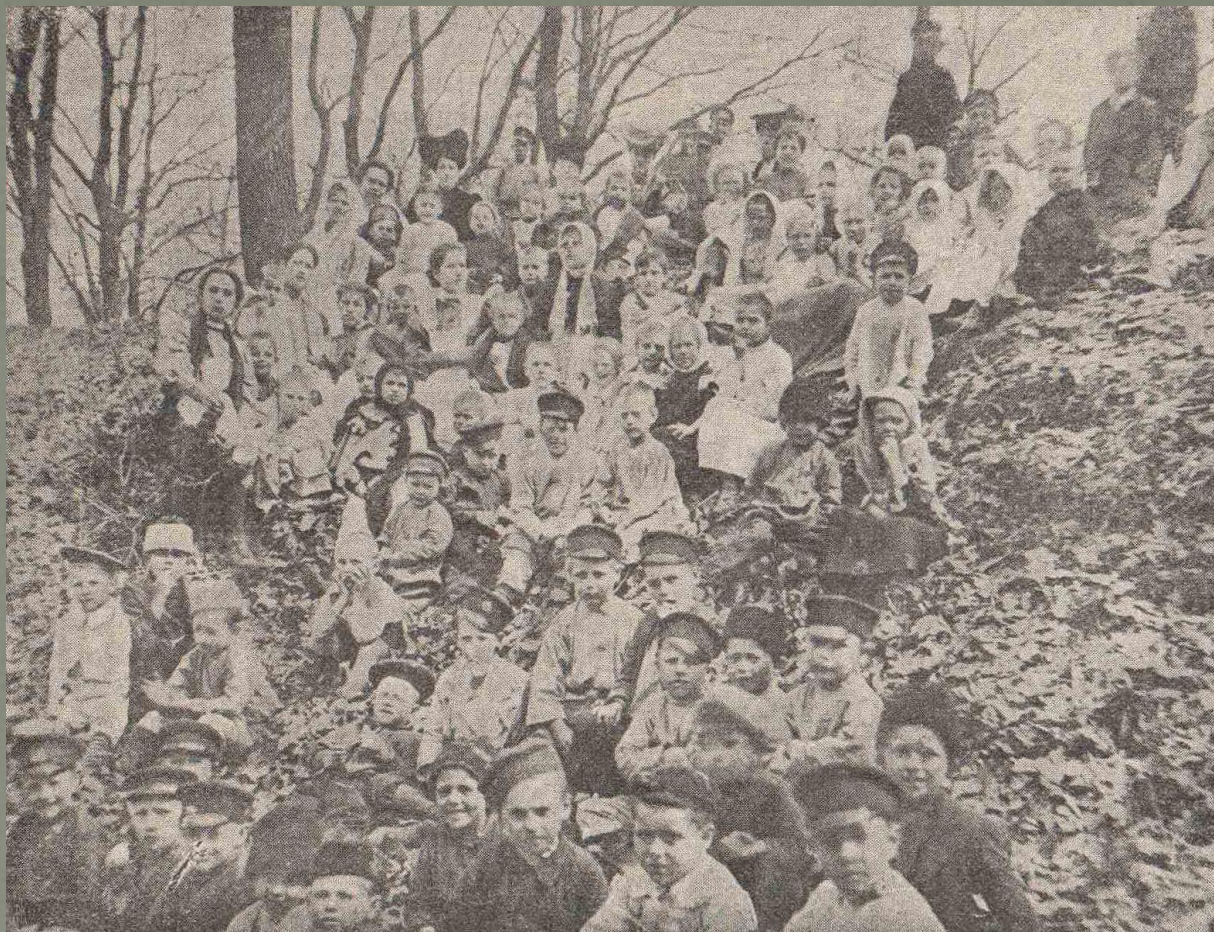
Дитячий садок Київського товариства народних дитячих садків, організований подружжям Лубенців, на екскурсії у Боярці 22 травня 1908 року