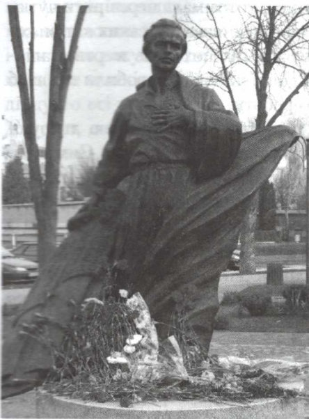
Пам'ятник поетові в Черкасах

1-й ведучий. Влада боялася поета навіть після його смерті: творчість замовчували, ціле десятиліття