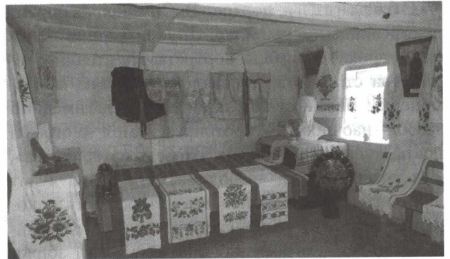
Интер'єр хати-музею Василя Симоненка

1-й ведучий. Друкувати свої вірші Василь Симоненко не квапився, бо були ці твори правдивими, говорилося в них не про любов до партії і вождя, а про простих людей. Попри те його поезії