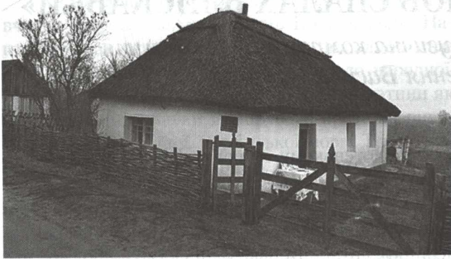
Хата Василя Симоненка (тепер музей) у с. Біївці на Полтавщині

1-й декламатор. Зі спогадів Ганни Федорівни: «Під час фашистської окупації, у 1942 році, Василь пішов у школу. До школи йому доводилося ходити за 9 кілометрів, бо 4 класи вчився Василь у Біївцях, а потім у сусідніх селах: Єньківцях і Тарандинцях. Зодягнений він був найгірше у класі, але не зважав на це: багато читав й учився краще від всіх у класі. Якось насипала йому великої квасолі замість паличок, щоб учився рахувати. Але він походив з нею усього два дні, приніс додому і каже: «Квасоля потрібна для борщу, а я і так вмю рахувати до ста». Василь любив весну, коли все зеленіє і цвіте. І каже було мені: «Я поки дійду, то всі уроки передумаю». А повертався додому, то, доки уроки не поробить, не їстиме і не гулятиме».