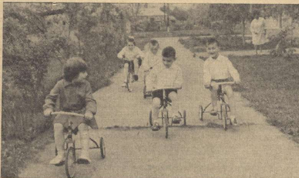
Весела прогулянка (дошкільний заклад Рогозівського радгоспу Київської області)