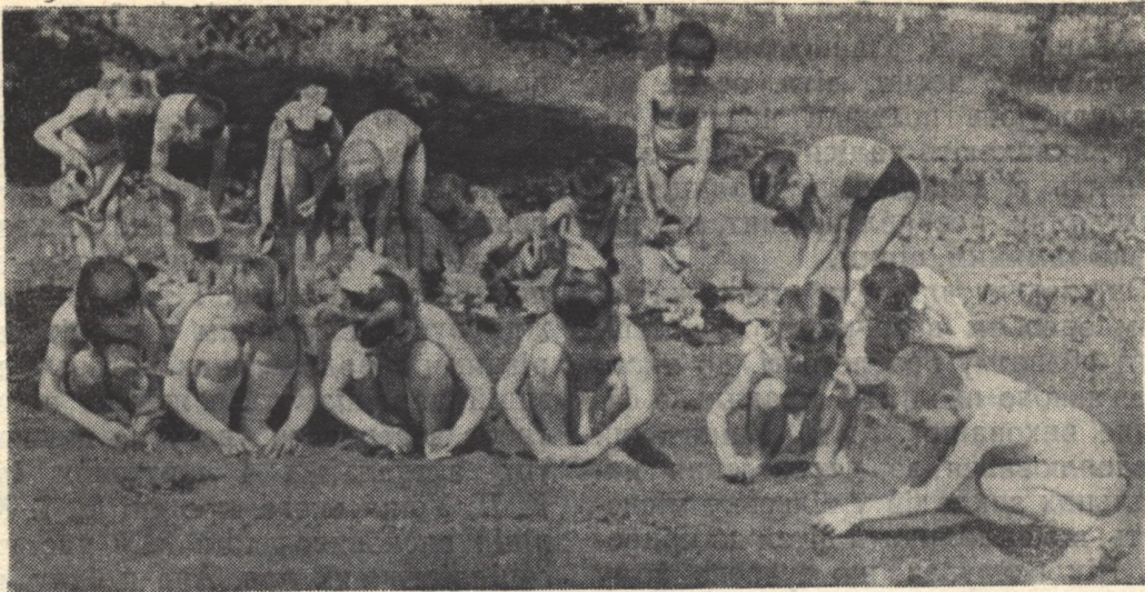
Старанно працюють на своєму городі вихованці Васильківського дитячого садка № 1 на Київщині.

дуже важливо для виховання любові до свого народу. Голос рідної природи сповнений думок і почуттів, які пробуджують у дитини любов до Батьківщини.