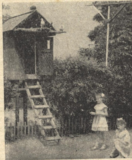
Багато радості приносить догляд за голубами.

Доглядаючи голубів, діти узнали про них багато цікавого, наприклад, що своїх пташенят вони годують так званим зобним молоком, а коли ті трохи підростуть, годують