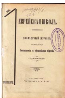
Рис.2 Журнал Еврейская школа, сентябрь, 1904 р.

«Атений» (1828—1830, журнал критики, современной истории и литературы), «Библиотека для чтения» (1822—1823, журнал словесности, наук, художеств, промышленности, новостей и мод), «Вестник воспитания» (1890—1917, научно-популярный журнал), «Воспитание и обучение» (1901—1916), «Гимназия» (1888 – 1900, журнал филологии и педагогики),