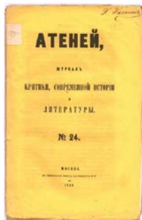
Рис.1 Журнал Атений № 24, 1858 р.

«Атений» (1828—1830, журнал критики, современной истории и литературы), «Библиотека для чтения» (1822—1823, журнал словесности, наук, художеств, промышленности, новостей и мод), «Вестник воспитания» (1890—1917, научно-популярный журнал), «Воспитание и обучение» (1901—1916), «Гимназия» (1888 – 1900, журнал филологии и педагогики),