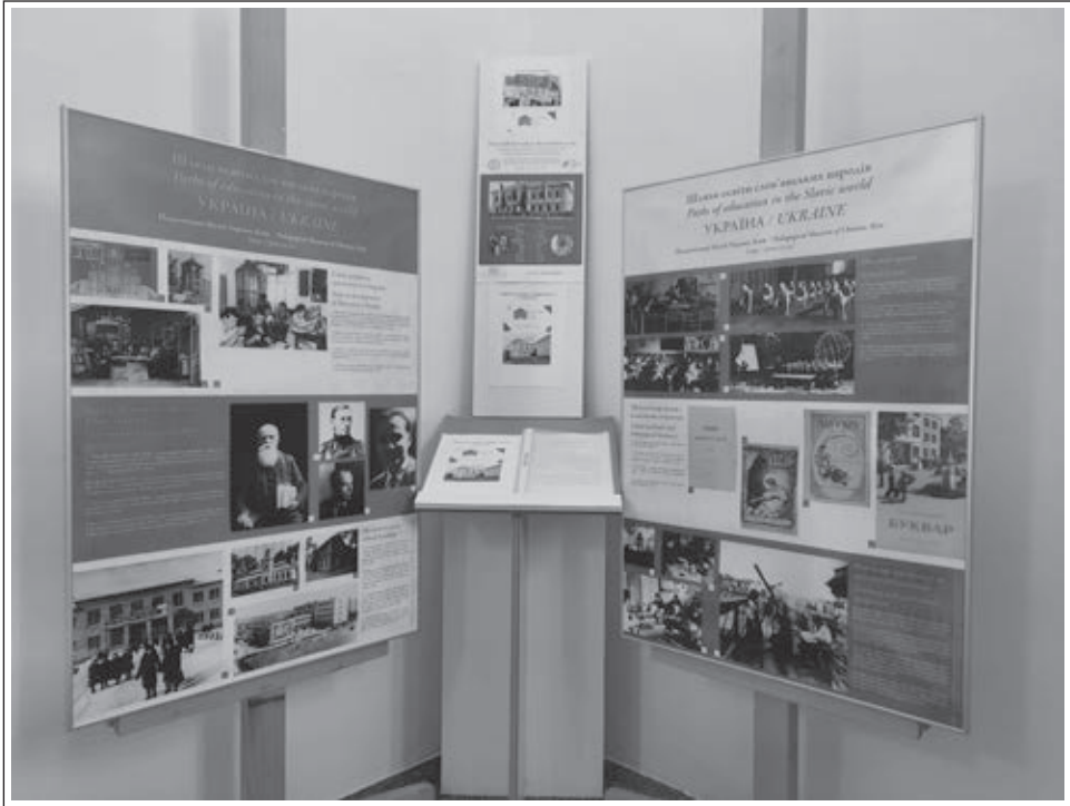
Solidarnostna tema o zgodovini šolstva v Ukrajini, razstava v kotu ob vhodu v Slovenski šolski muzej, aprila 2022.

pogled na pedagoški profil ukrajinskih študentov od sredine 19. stol. do 1970 (The Phenomenon of the Pedagogical Profile of a Student: from Ushinsky to Sukhomlinsky). 39 S temo proučevanja osebnosti učencev se je avtor raziskovalno že ukvarjal, 40 posebej s pedagogom V. Sukhomlynskym, 41 v letu 2020 pa je izdal v ukrajiniščini obsežno monografijo Fenomen pedagoških značilnosti študenta: od Ušinskega Sukhomlynskega. Za večjo dostopnost ima knjiga, ki je dostopna tudi na spletu, še angleški povzetek (str. 366–372), pa tudi iz zgodovinskih virov zbrane različne tematske priloge. 42