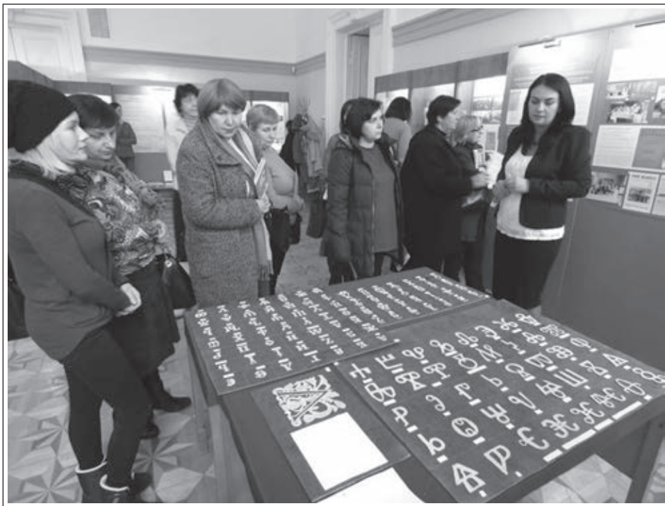
Razstava Poti izobraževanja v slovanskem svetu v Pedagoškem muzeju Ukrajine v Kijevu, 2019 (hrani SŠM, fototeka,).