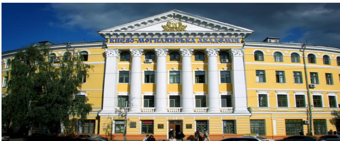
Національний університет «Києво-Могилянська академія»

Вигляд Старого корпусу Києво-Могилянської академії (південний фасад) у 30- 40-х рр. XVIII ст.