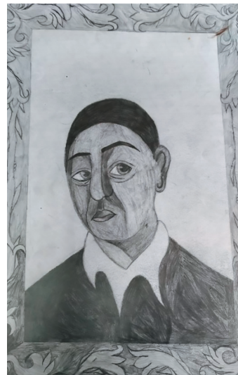
Чеховський Олександр, 13 р. «Портрет Г. Сковороди»