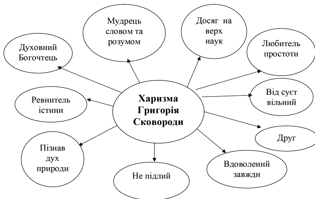
Рис. 2. Харизма Г. С. Сковороди за М. І. Ковалинським (із надгробного напису)

Отже, ми можемо говорити, що харизма, духовний феномен Г. С. Сковороди – ідеал праведника з ознаками Богоносця, милостивого, Безсрібника, Постника, Святителя, Апостола, Пророка, мудрістю схожого на давньозавітного Праведника Ноя, натхненного Святим Духом, чистого серцем, морально непорочного, досконалого розумом, серцем, життям старця-мудреця – святого Української Православної Церкви. Можливо наші діти, внуки будуть свідками канонізації Григорія Савича Сковороди.