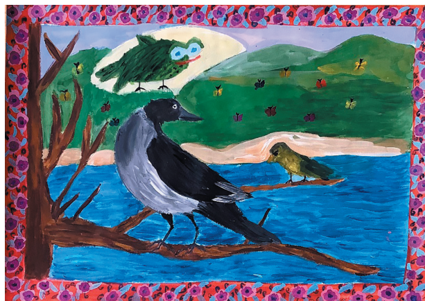
Козієнко Діана, 10 р. Байка «Ворон і Чиж»