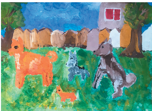
Тєніщєва Поліна, 7 р. Байка «Дві Собаки»