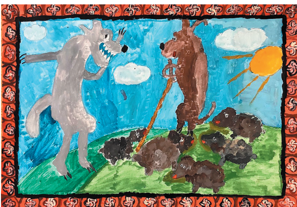
Шахі Ірані Давид, 10 р. Байка «Собака й Вовк»