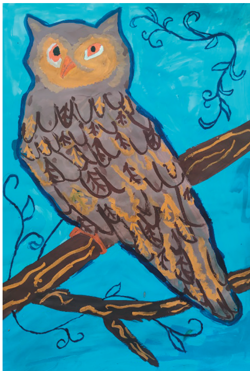
Осадча Анастасія, 10 р. Байка «Сова і Дрізд»