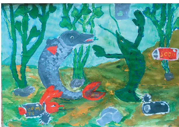
Заець Ілля, 8 р. Байка «Рак та Щука»