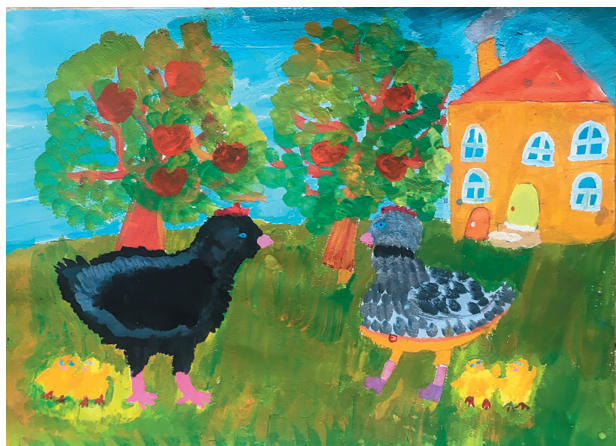
Кузьміна Діана, 6 р. Байка «Дві Курки»