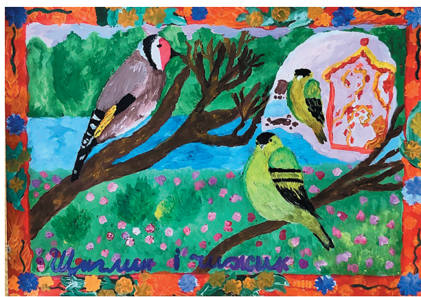
Головня Євгенія, 10 р. Байка «Щиглик і Чижик»