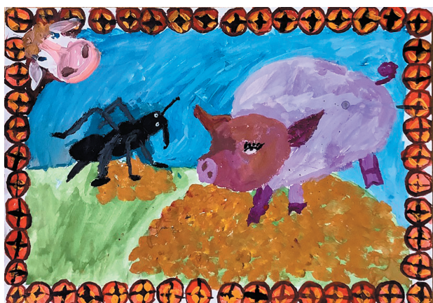
Шахі Ірані Роман, 9 р. Байка «Мурашка і Свиня»