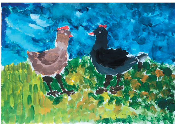
Дідик Іван, 10 р. Байка «Дві Курки»