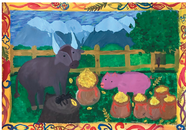
Цивіна Діана, 12 р. Байка «Мурашка і Свиня»