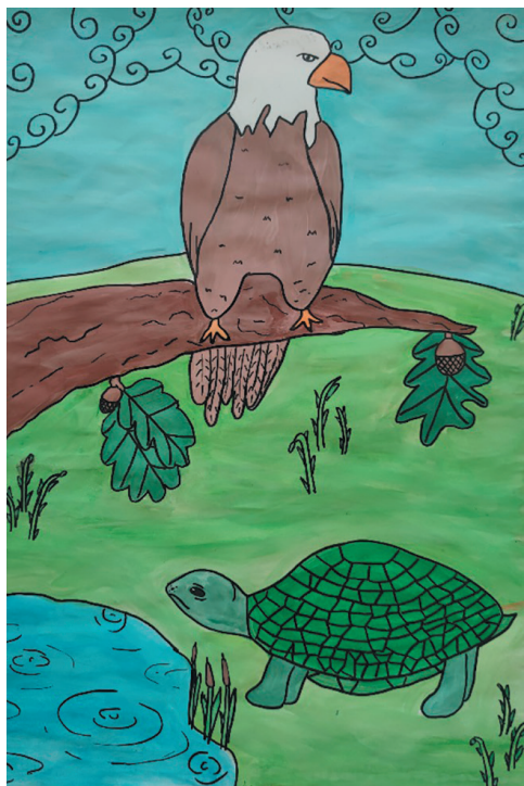
Воскресенська Ольга, 10 р. Байка «Орел і Черепаха»