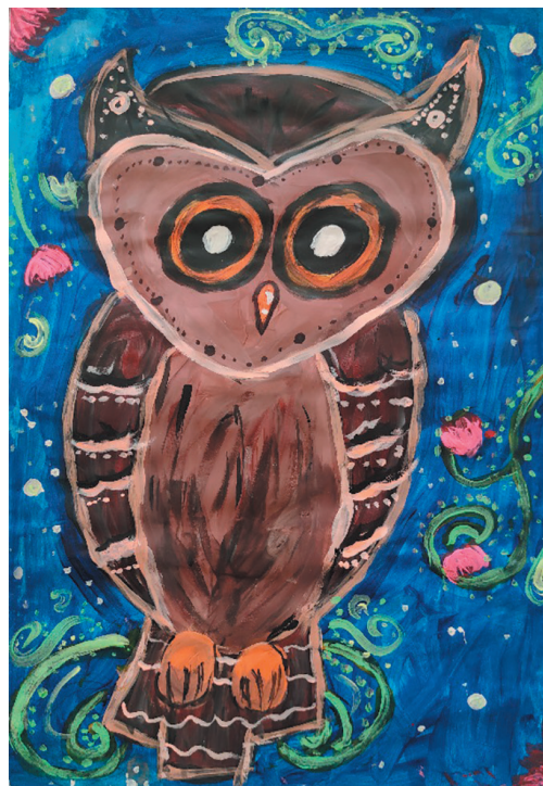
Нестерова Каріна, 10 р. Байка «Сова і Дрізд»