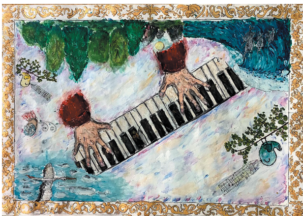
Ракітін Альберт, 12 р. Байка «Оселка і Ніж»