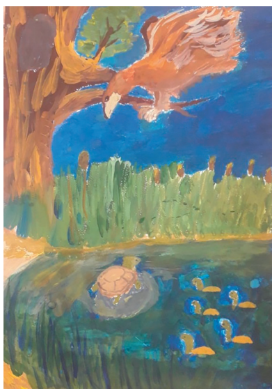
Нестерчук Артем, 9 р. Байка «Орел і Черепаха»