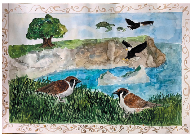
Папушенко Назар, 13 р. Байка «Жайворонки»