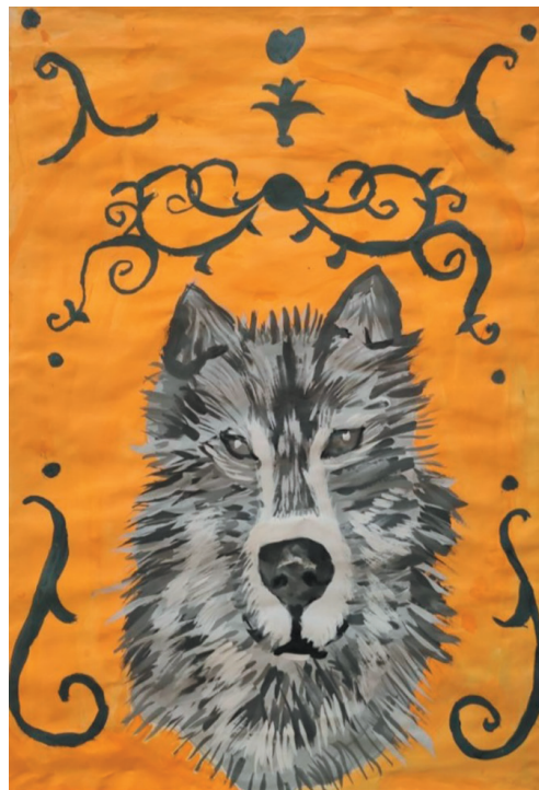
Торчинська Аріна, 11 р. Байка «Вовк і Собака»