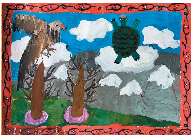
Дяцуник Лідія, 9 р. Байка «Орел і Черепаха»