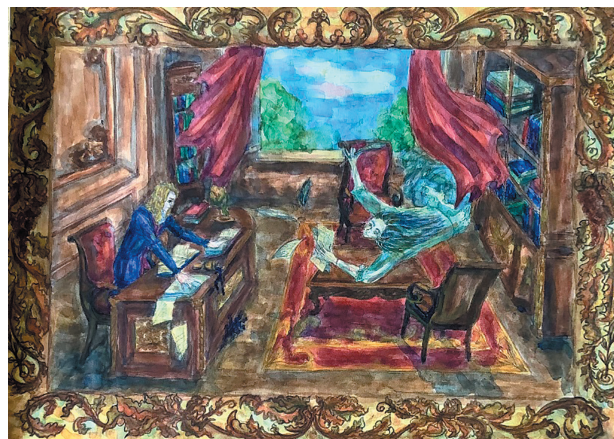
Сідляр Ірина, 15 р. Байка «Вітер і Філософ»