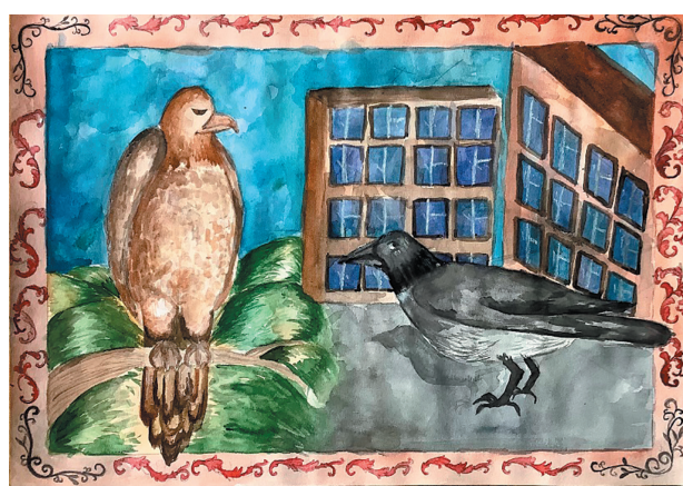
Хоменко Валерія, 11р. Байка «Орел і Сорока»