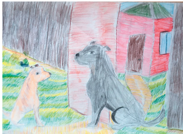
Жеребіна Влада, 10 р. Байка «Дві собаки»