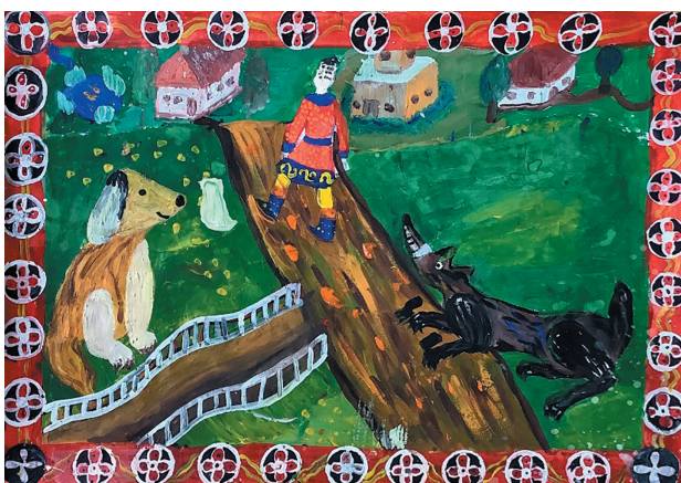
Химченко Софія, 10 р. Байка «Пси»