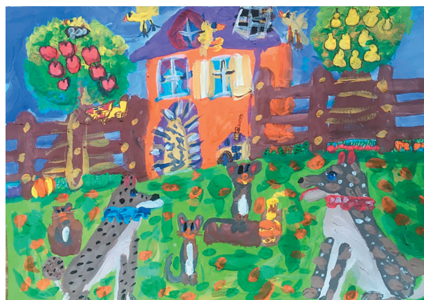
Бебешко Маргарита, 7 р. Байка «Дві собаки»