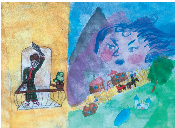
Семеренко Єва, 8 р. Байка «Вітер і Філософ»