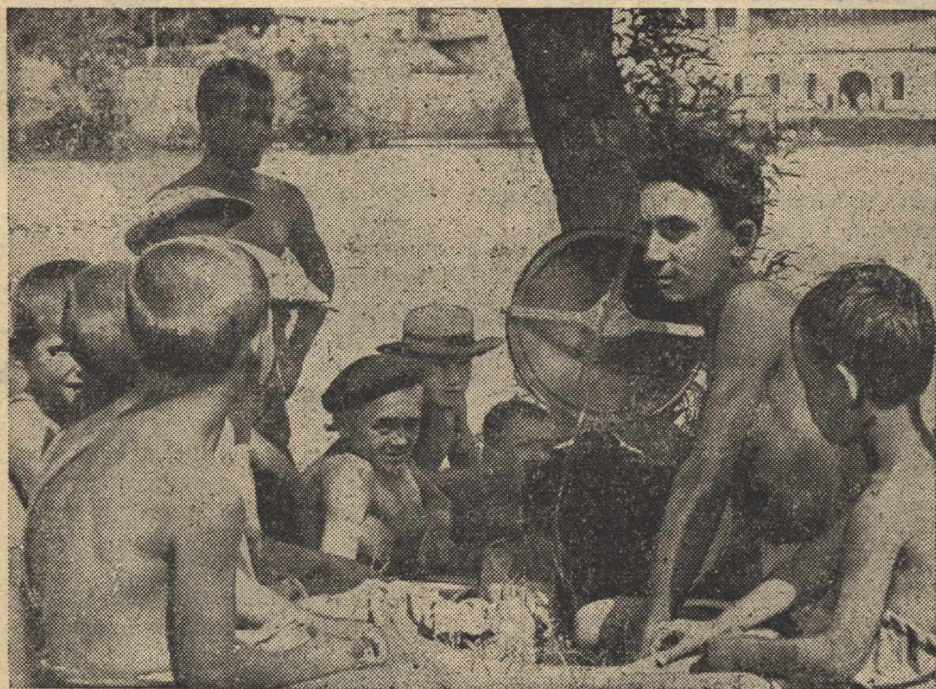
Заводський ставок одне з любмих місць піонерів та школярів. Тут купаються, загорають, читають. Нещодавно піонери радіюфікували цей куток і зараз слухають радіо (с. Кагарлик).