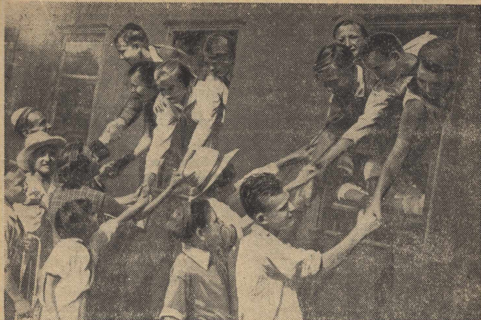
8. І ось закінчилась екскурсія. Як важко розлучатися! На фото: ребята прощаються перед від'їздом додому.

перестане липнути до рук. Шматок глини треба скачати і з нього виліплювати задуману річ, не роз'єднуючи його на окремі шматки і не доліплюючи з іншого окремих частин. Так, наприклад, коли дитина хоче виліпити півника або собаку, вона бере шматок глини, і видавлює на ньому ноги, хвіст, крила та інше. Приліплювати ж крила, ноги тощо, зроблені з іншого шматка глини,—не треба.