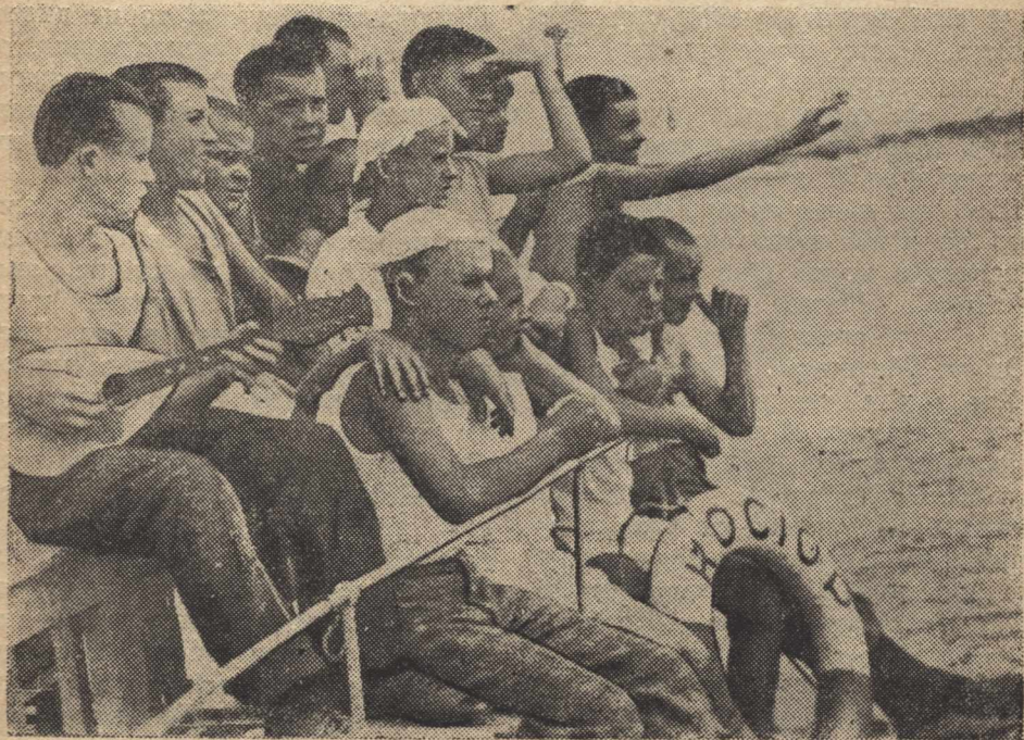
9. Експерсія ребят дитбудинків України до Дніпрогесу. На фото: ребята милуються краєвидами Дніпра.

Кіно-фестиваль довів нам, що використання кіно нашими школами і піонерськими загонами треба докорінно поліпшити. І справді, є багато таких дітей, що відвідують кіно часто, але безсистемно і безконтрольно, а бага-