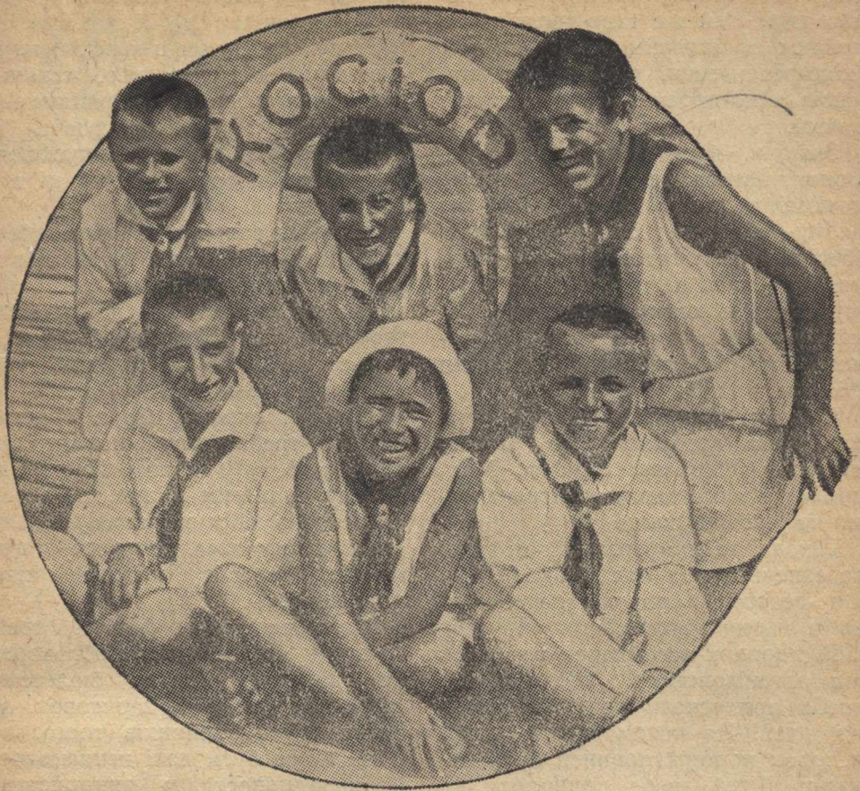
10. Експерсія ребят дитбудинків до Дніпрогесу. На фото: майбутні освовітці.

то знову таки це можна краще зробити в умовах школи та загоу.