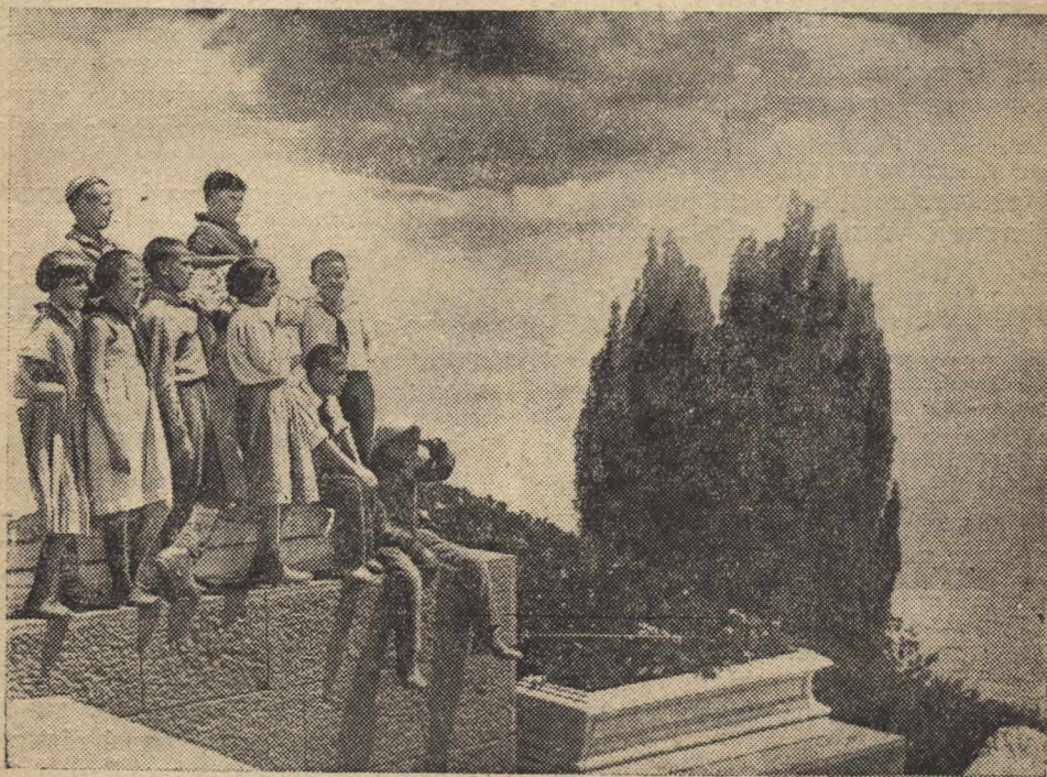
7. Група екскурсантів біля колишнього Воронцовського палацу роздивляється прекрасний краєвид Чорного моря.

Мистецтво художнього читання широко розвивається в нашій школі. Воно повинно в нас розцвісти.