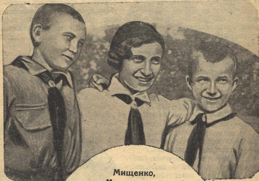
Мищенко, Мижерицька, Поперека — кращі ланкові (учні школи ім. тов. Кагановича в Чорнобилі)»

Досвід передових має бути надбанням усіх шкіл, цілої піонерської організації.