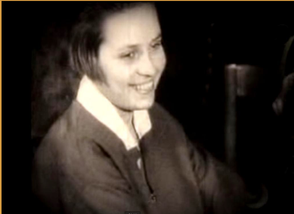
Н. Забіла. (кадр з документальної