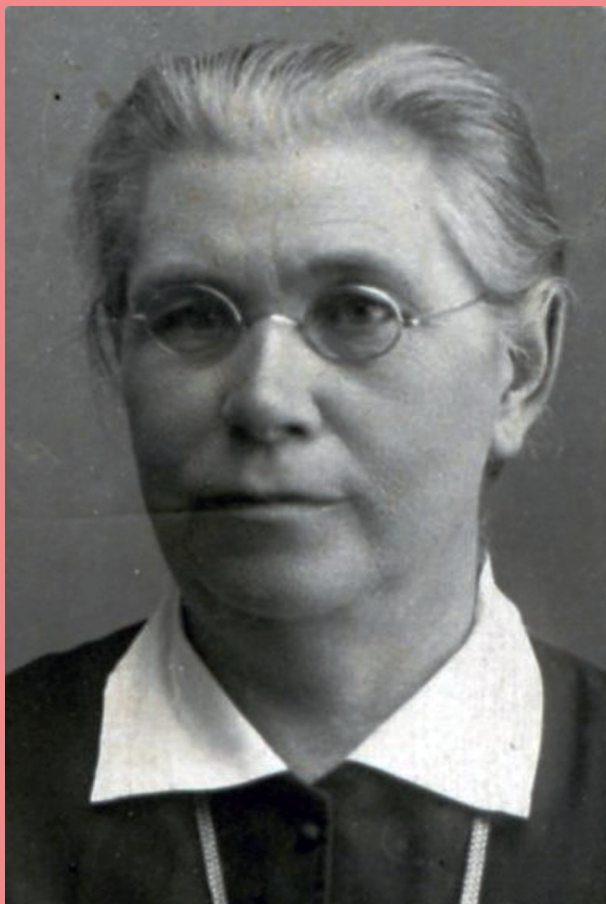
М. Грінченко Київ, 1910-ті рр.